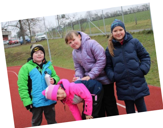
Paní vychovatelka z ŠD Smajlíci

V úterý 24. ledna jsme si v ŠD Smajlíci zpestřili zimní dny originální bojovkou „Po stopách yettiho“. Hra začala nalezením mapy ledové země a úvodním dopisem, v němž yetti vypráví, proč se musel vydat na sever do hor a motivuje k pátrání po pokladu, který v těchto končinách ukryl, než odešel do Himalájí. Děti postupně potkaly ve zprávách devět yettiho přátel, od kterých zjistily po splnění úkolů indicie k objevení pokladu. Přesto, že celou akci provázelo velmi chladné počasí, dětem se hra líbila, a to hlavně proto, že byla nejen „lušticí“ a logická, ale i pohybová a zábavná.